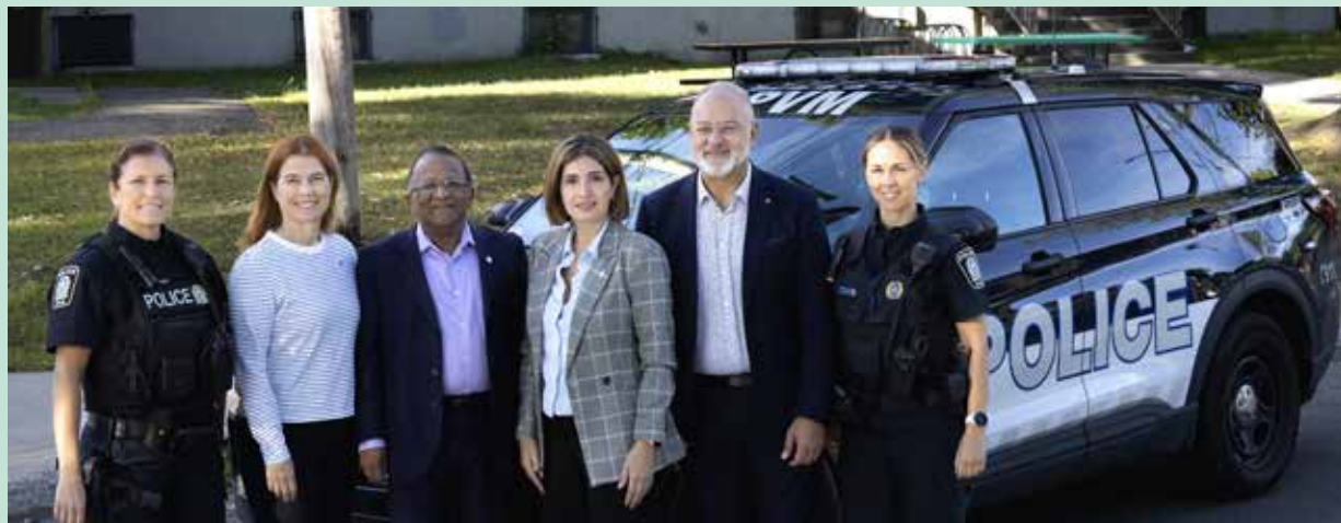
Des membres du conseil de Saint-Laurent posent en compagnie de représentantes du poste de quartier 7 devant l'école primaire Bois-Franc-Aquarelle.